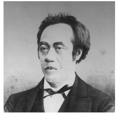
日本初の 私立医学校を創立 長谷川泰 1842~1912