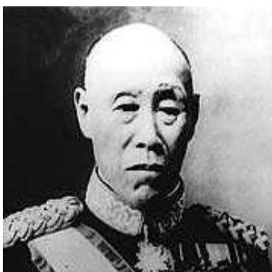
森鷗外の上 陸軍医總監 石黒忠愨 1845~1941