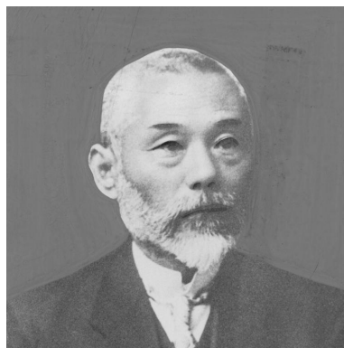
日本人の起源追求 解剖学の先駆者 小金井良精 1859~1944