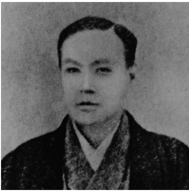
医学用語を発明した 語学の天才 司馬凌海 1839~1879