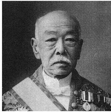
日本初の医学博士 明治天皇の主治医 池田謙斎 1841~1918